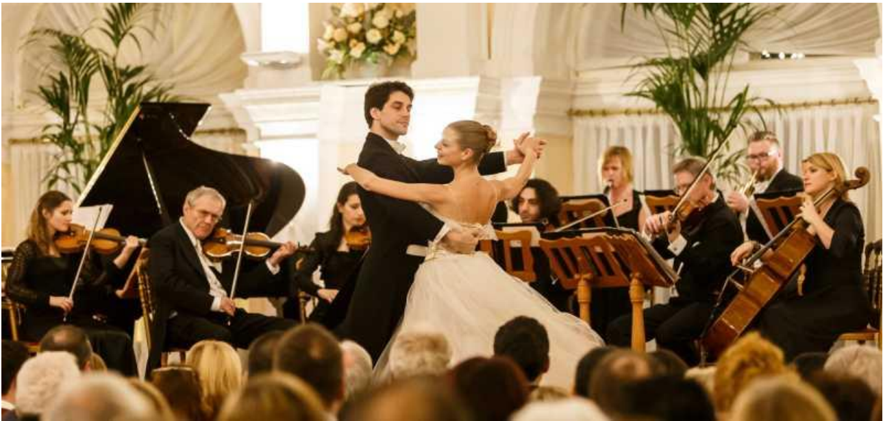
Au choix des participants

L'année 2025 marquera le 200 ème anniversaire de Johann Strauss (fils) et les Concerts Classiques Viennoise accordent cette année une attention particulière au « Roi de la valse » dans leur programme.